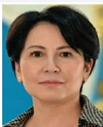
Арыстанкулова Гульсара Мереевна: путь от выпускницы КазУМОиМЯ до Посла во Франции

Бос уақытында заманауи мәдениетке, әсіресе қазақстандық инди-поп музыкасына қызығушылық танытады және Қазақстанды бай мәдени тамыры бар прогрессивті мемлекет ретінде танытудың маңыздылығын атап өтеді.