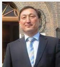
Дауренбек Ырысқали Рақымұлы — Қазақстан Республикасы Сыртқы істер министрлігінің Қытай Халық Республикасының Үрімжі қаласындағы Паспорттық-визалық қызметінің Кеңесші-Басшысы

В 2024 году ей был присвоен высший дипломатический ранг Чрезвычайного и Полномочного Посла. Под её руководством дипломатическая миссия в Париже активно содействует укреплению стратегического партнерства, развитию сотрудничества в сферах энергетики и привлечению французских образовательных технологий в Казахстан, включая проекты по открытию филиалов ведущих вузов Франции.