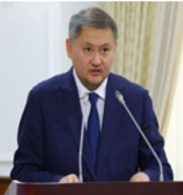
Министр науки и высшего образования РК Саясат Нұрбек на заседании Правительства доложил о проводимой работе по внедрению инноваций в курируемой им сферу

Он отметил, что в соответствии с поручением Главы государства инновационная деятельность была передана в ведение Министерства науки и высшего образования.